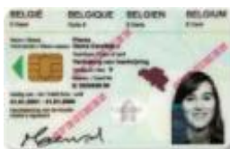
Duurzaam verblijf of E+ of F+ kaart

F kaart voor niet-EU familielid van Belg-EU-EER