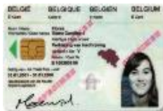
Bijlage 9 of F kaart

F kaart voor niet-EU familielid van Belg-EU-EER