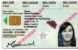
Bijlage 8 of E kaart